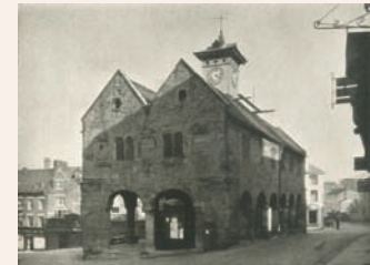
Torghall, Ross-On-Wye, England