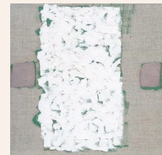
Maleri av Robert Ruyman