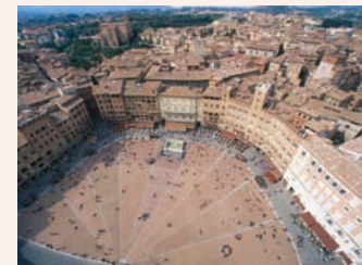
Campo, Siena, Italien

Med dette forslaget ønsker vi å skape en varig og brukbar bygning for Notodden samt et inspirerende hjem for Blues musikken i dag og i fremtiden.