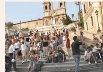
Spansketrappen, Roma, Italia